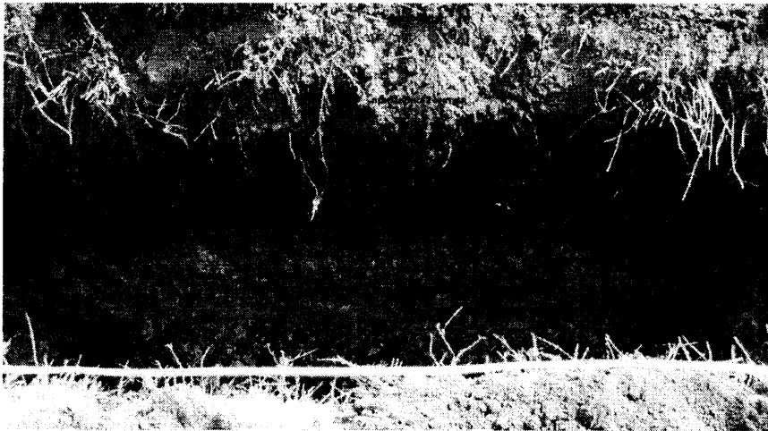
Рисунок 3 - Стенки шурфа с серыми пятнами между черноземом и глиной.